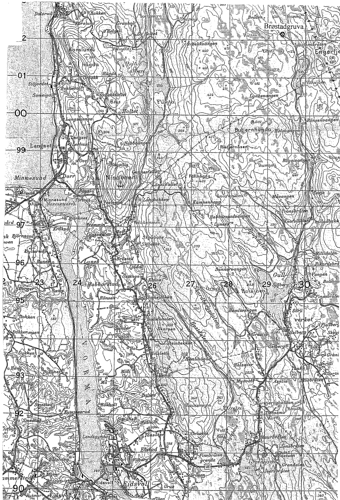
Figur 1. Kart over området ved Gullverket i Eidsvoll kommune (Statens kartverk M711, Blad 1915 I). Rutenettets side tilsvarer 1 km. Brøstadgruva er markert med en pil.